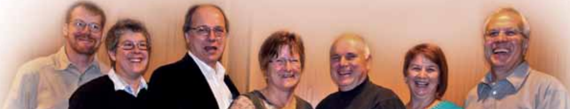
L'équipe de négociations du personnel scolaire