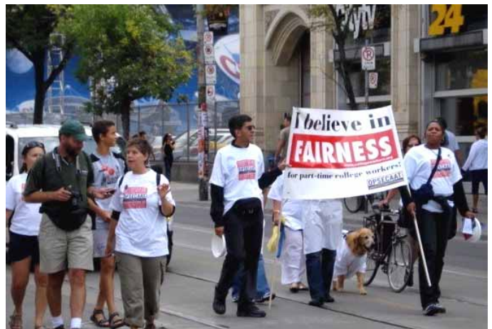
Toronto : Les membres de l'OPSECAAT défilent sur la rue Queen lors du défilé de la Fête du travail