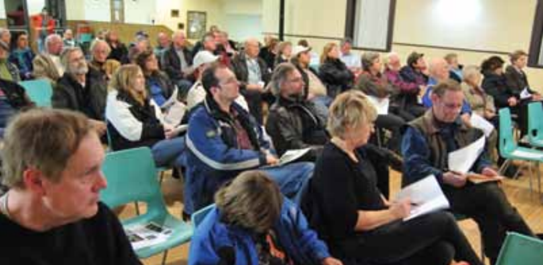
Les résidents de Mount Albert se réunissent pour examiner la question d'un nouveau magasin LCBO