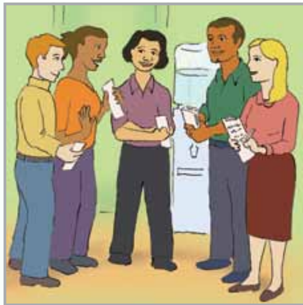
Illustration: Lisa Walter